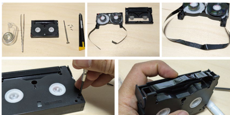
切断したHi8テープ修復の様子

実験映画、ビデオアート、メディアアート分野の草分け的存在である飯村隆彦（1937年-2022年）のフィルム作品、ビデオテープ作品のデジタル化及びアーカイブ作業を行います。ユネスコが警鐘を鳴らしているように、磁気カセットテープの磁性体の劣化と再生ヘッドの生産停止により、今後再生が不可能になることが危惧されており、速やかなダビングとデジタル化が急がれます。本事業は飯村隆彦が残した8mmフィルム作品とカセットテープをデジタル・データに変換し、リスト化を行った上で必要なものは保存修復を施し、その芸術的功績を次世代に残し、また国内のメディアアートの貴重な資料としてアーカイブ化を試みるものです。