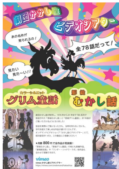
劇団かかし座ビデオシアター 宣伝チラシ