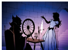
いばらひめ (シンデレラ)