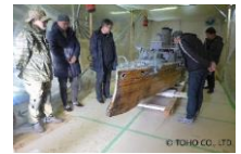
ミニチュア類の保存に向けた修復・復元

長期保存や展示等の利活用のためには修復・復元の必要があったミニチュアの修復・復元を実施。2016～2018年にかけては円谷英二監督の最後の長編作品となった映画『日本海大海戦』で使用された全長6mの戦艦三笠の修復復元を実施。