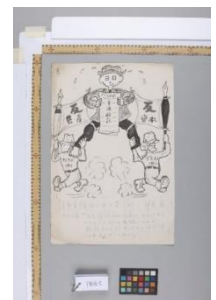
政治マンガ原画／ 清水崑展示館蔵