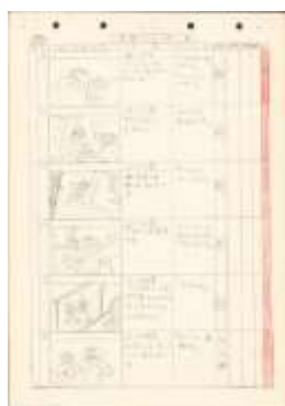
鉄腕アトム第8話「電光人間」