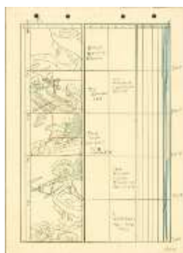
リボンの騎士第1話「王子と天使」