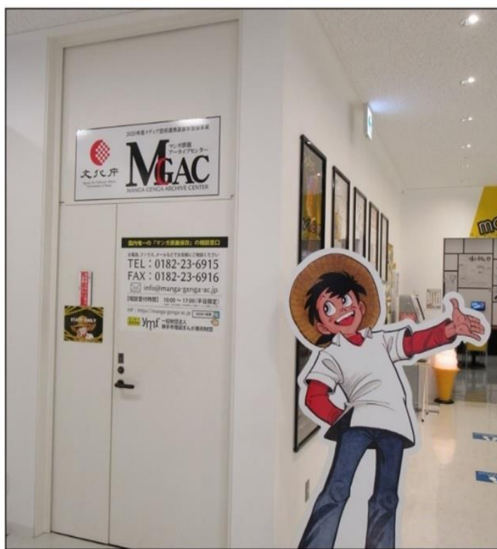
美術館内に設置されたマンガ原画アーカイブセンター（1F：マンガカフェ入口隣）