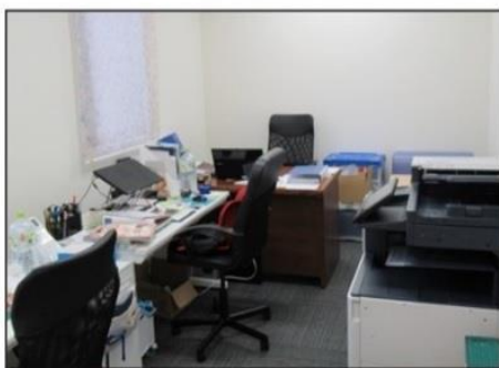
センターの執務スペース