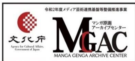
マンガ原画アーカイブセンターロゴ